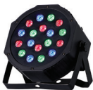
Mini Par Can